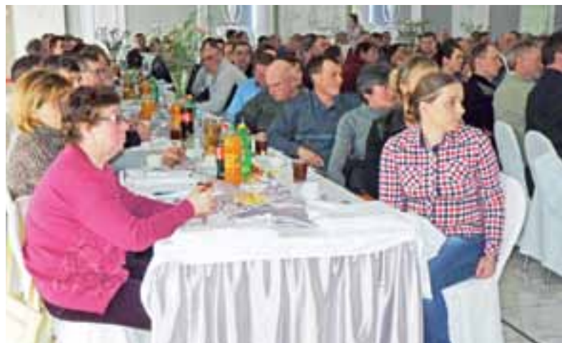
Na sali licznie zgromadzili się hodowcy m.in. z powiatów łowickiego, kutnowskiego i sochaczewskiego. I nie byli to tylko panowie.

Niedźwiada | Do Wiktopolii tłumnie zjechali hodowcy bydła