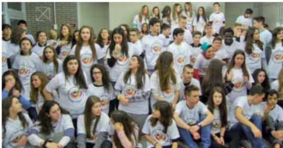
Gospodarze z katalońskiej szkoły w Santpedor oraz goście z Turcji, Portugalii i Polski na wspólnym zdjęciu.

Premierowe przedstawienie zostało wystawione 11 lutego, a wstęp na nie był otwarty dla wszystkich mieszkańców. Było ono także transmitowane na żywo przez telewizję internetową. Podobnie jak występy przygotowywane w ramach Comeniusa, składało się z kilku odsłon przygotowanych przez każdą grupę narodową (każda część trwała około 10 minut), miało też wspólny element – in-