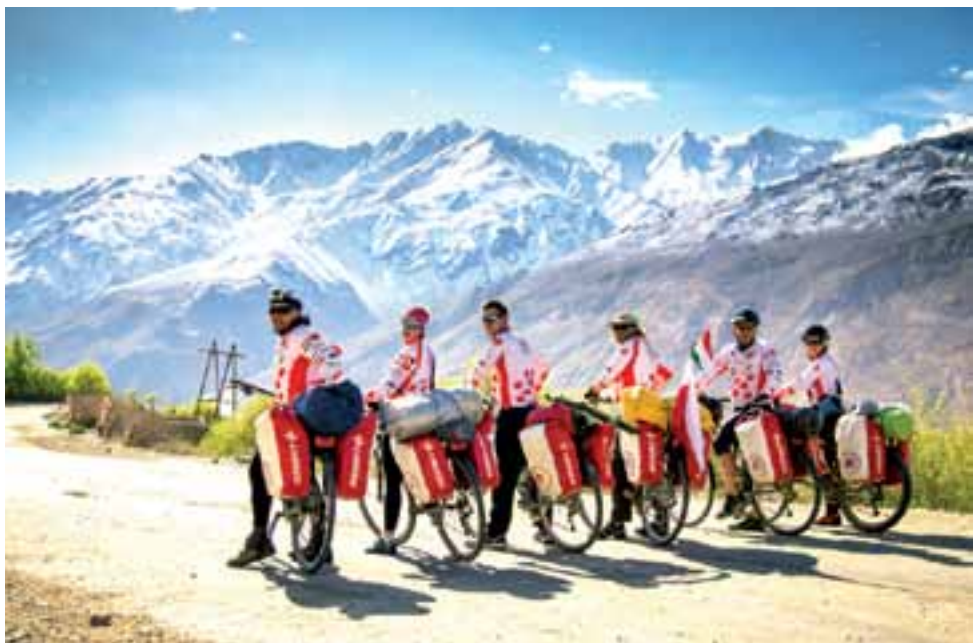
Z Polski jechali sztafetą do Japonii m.in. przez góry środkowej Azji.

Łowicz | Przed przeglądem podróżników rowerowych