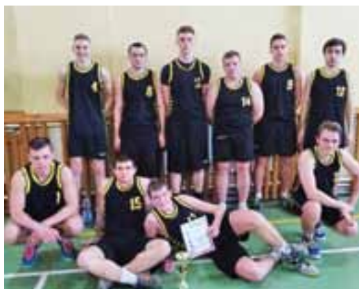
Reprezentacja LO im. A. Mickiewicza w Żychlinie podczas Mistrzostw Powiatu w Koszykówce Szkół Ponadgimnazjalnych w Kutnie.