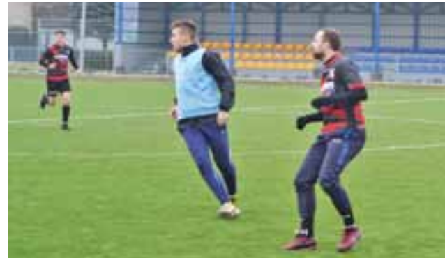
Mecz na stadionie miejskim w Żychlinie pomiędzy GKS Bedno a Astrą Zduny, zakończony wygraną Bedna 2:1.