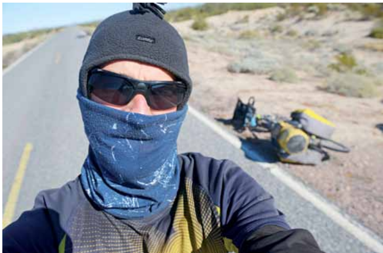
Jadąc po górskich drogach, na wysokościach przekraczających 2000 m n.p.m., trzeba być ubranym ciepło.

Po przebyciu z południa na północ jakichś 4 tysięcy kilometrów, w okolicach wysoko położonego Aguascalientes o zimie i zimnie trudno sobie nie przypomnieć. Tam dopiero się okazuje, jak różnorodny bywa klimat Meksyku. Komu kraj ten kojarzy się jedynie z sombrero, mariachi i wiecznym latem zdradzę, że to bujda. Na grzybach w dodatku resorach. Południe owszem, jest upalne, wilgotne