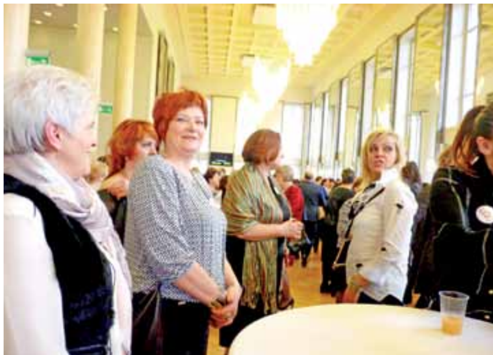
W przerwie widowiska baletowego Wasilija Miedwediewa panie z gminy Bedno na teatralnym korytarzu mogły skorzystać z naturalnych soków, kawy i herbaty, o co zadbała Izba Rolnicza Województwa Łódzkiego, współorganizator wyjazdu z okazji Dnia Kobiet.

W niedzielę uśmiech gościł na twarzach kobiet. Widowisko baletowe było ucztą kulturalną. Piękne dziewczyny i mężczyźni w niezwykłych strojach, muzyka Czajkowskiego w wykonaniu orkiestry na żywo, gra świateł, efekty specjalne i scenografia zapierająca dech w piersiach składały