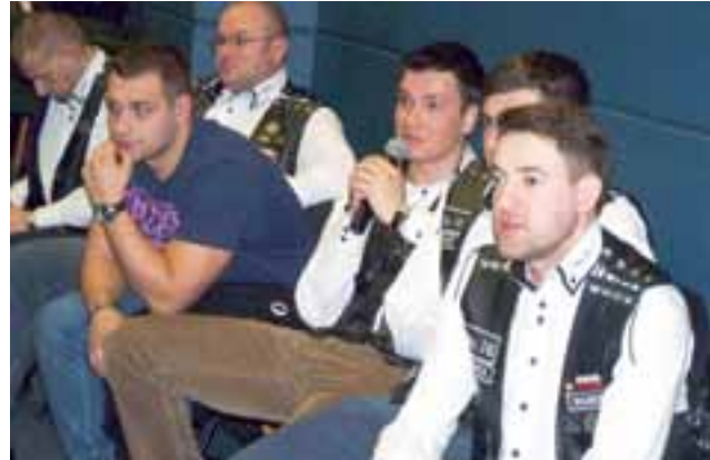
A tu już nieco młodsze pokolenie motocyklistów z No.16. Do zaproszonych gości mieli kilka pytań dotyczących wyprawy.

Widzów ciekawiło jak panowie się poznali i jak doszło do zawiazania się „drużyny”. – Jestem