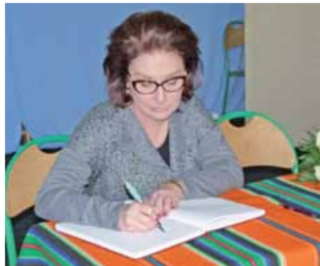
Pozostanie ślad tej wizyty. Małgorzata Kidawa-Błońska wpisuje się do książki pamiątkowej Zespołu Szkół SRWWIO w Starym Waliszewie.