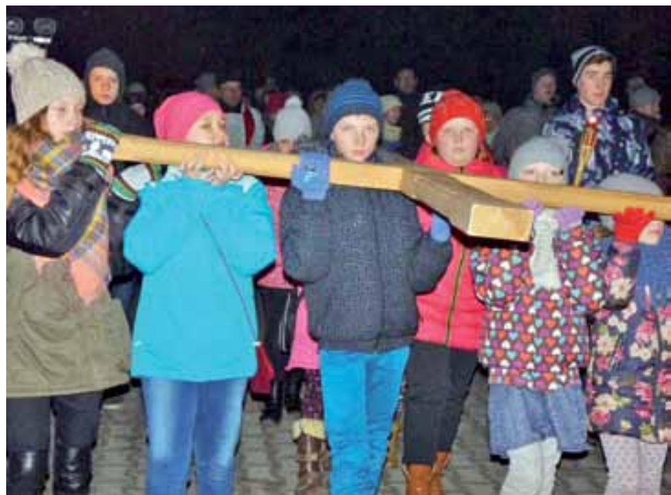
Krzyż niosły m.in. dzieci. Dźwignęły go też kobiety, mężczyźni, a na końcu krzyż ponieśli wszyscy wspólnie.

Kolejna Droga Krzyżowa, tym razem ulicami naszego miasta, wyruszy spod kościoła Chrystusa Dobrego Pasterza do bazyliki katedralnej 18 marca. aa