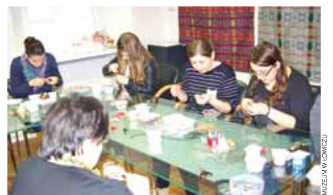
Warsztaty sutaszu na Dzień Kobiet.

Ich uczestnicy będą pracować na wierzbowych gałązkach, udekorowanych borówkami, prawdziwych kwiatach i bibułkach. Uczestnicy warsztatów dowiedzą się jak wyglądały tradycyjne