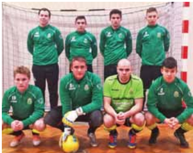
Mistrzem BLF 2016 w Bielawach została ekipa SMS Dąbkowice.