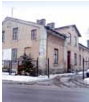
Kamienica przy ulicy 3 Maja 5 w Żychlinie też czeka na naprawę przeciekającego dachu.

– Na razie mamy skromne środki na bieżące remonty – 40.000 zł – przyznaje Marek Jabłoński, dyrektor SZB. – Na wymianę okien przeznaczamy tylko 4.000 zł. Lokatorzy, którzy zgłaszają taką po-