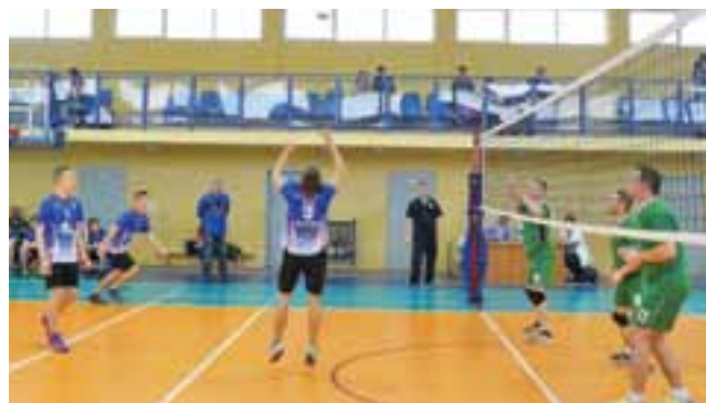
Akademia Siatkówki Żychlin przeciwko zespołowi Dąbrowice.

Podczas 12. kolejki ligi, w sobotę 5 marca, przeciwnikiem siatkarzy Akademii Siatkówki Żychlin była drużyna Dąbrowice. Siatkarze z Żychlina przegrali to spotkanie 2:1. Początek pierwszego seta to nerwowa gra i strata kilku punktów młodego zespołu. Drużyna z Dąbrowic kontrolowała wydarzenia na parkiecie i zakończyła pierwszy seta wygraną do 15. Kolejna odsłona przebiegała wyrównanie, w końcówce gry więcej zimnej krwi zachowali siatkarze Akademii Siatkówki, wygrywając