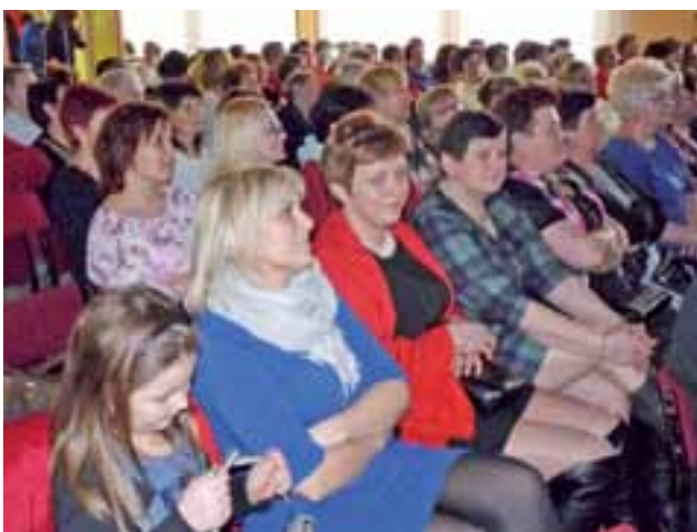
Gminny Dzień Kobiet. Na widowni zasiadły panie, na scenie produkowali się panowie.

z grupy Muchomorków. Na zakończenie wszystkie dziewczynki otrzymały samodzielnie przez chłopców wykonane, papierowe kwiatki.