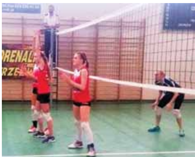
Volley Team Żychlin w jednym ze spotkań w Turnieju w Gostyninie.

Piłka siatkowa | Turniej Kobiet o Puchar Dyr. Placówki Alior Banku w Gostyninie