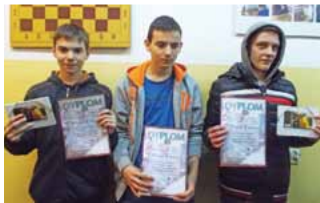
Młodzież już lepsza od dorosłych!!!