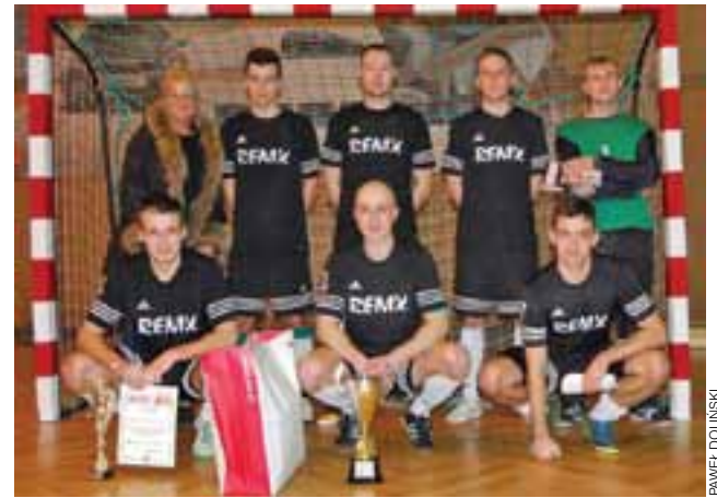
Renix wygrał Puchar Burmistrza w sezonie 2015/2016.