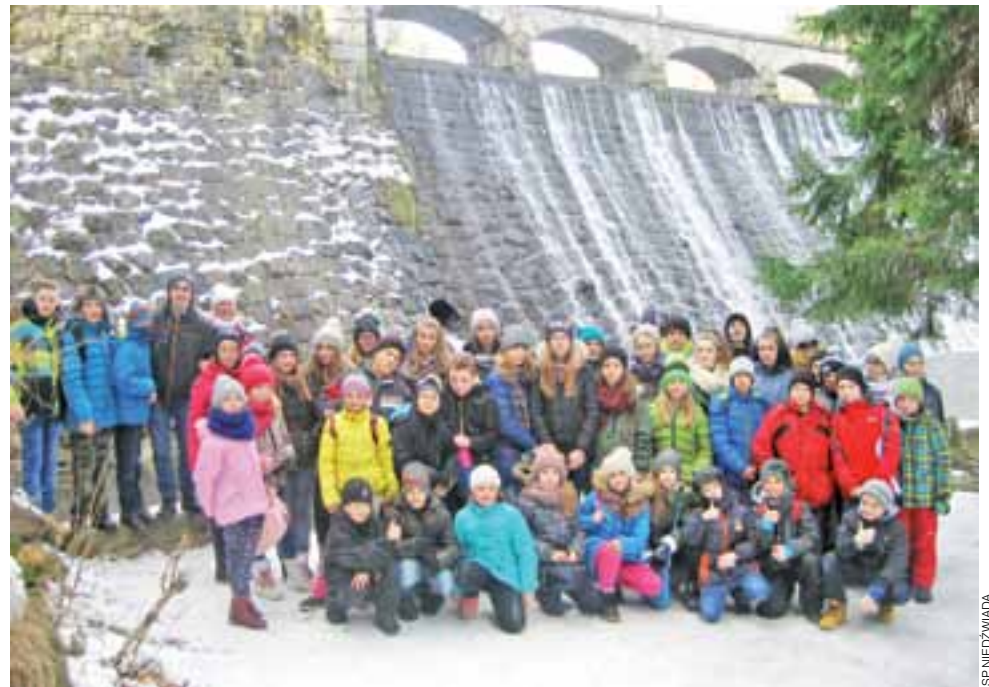
I jeszcze grupowe zdjęcie na pamiątkę i można wracać do domu.

Atrakcyjne miejsca w Karconoszach poznawali w czasie wyjazdowych wycieczek autokarowych. Odwiedzili Szklarską Porębę, gdzie przewodnik zaprowadził uczestników zimowiska m.in. pod najwyższy w polskich Sudetach wodospad Kamieńczyka oraz skwer Radiowej Trójki. Zwiedzili też kopalnię Liczyrzepa w Kowarach, świątynię Wang i kaplicę Św. Anny. Przeszli także szlak na Dziki Wodospad i nad zaporę na Łomnicy. W ramach konkursu pod hasłem „Ciekawostki Karpacza” uczestnicy zimowych ferii mieli za zadanie odnaleźć m.in. pomnik przyrody „lipę sądową”, Muzeum Turystyki i Sportu oraz najkrótszą ulicę w Polsce. Był też czas na oglądanie zbiorów minerałów w Muzeum Ziemi