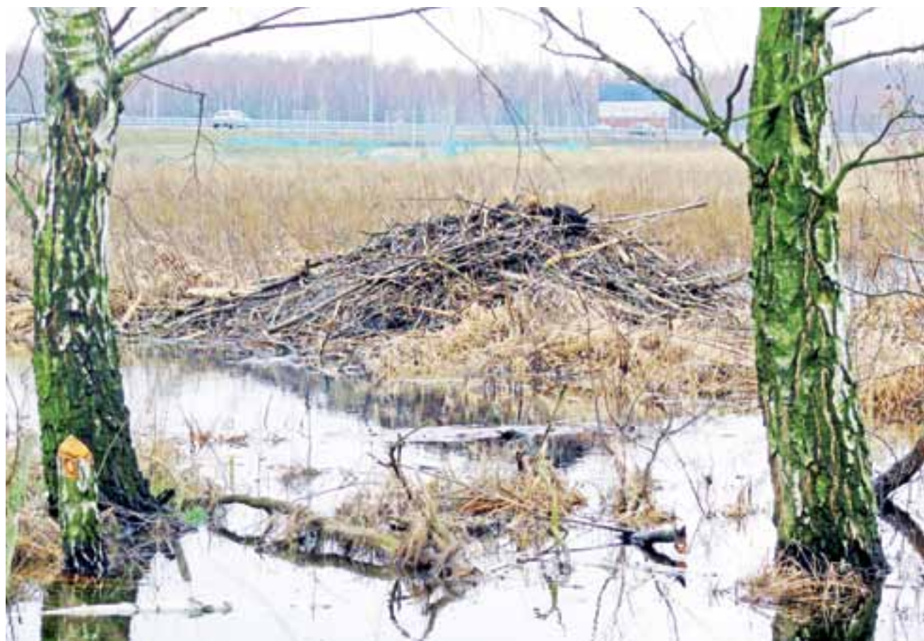
Bobry w sąsiedztwie Polesia zalały łąki, a na rozlewisku wybudowały żeremie. W tle widać autostradę A2.

Woda spiętrzona jest na wysokość około 80 cm.