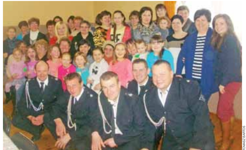
Pamiętkowe zdjęcia uczestników Dnia Kobiet w Ziąbkach, widać na nim zarówno panie jak i strażaków, którzy zrobili wiele, aby poczuły się zadowolone.