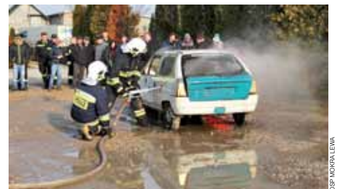
Jeden z testów praktycznych podczas pokazów w Mokrej Lewej.