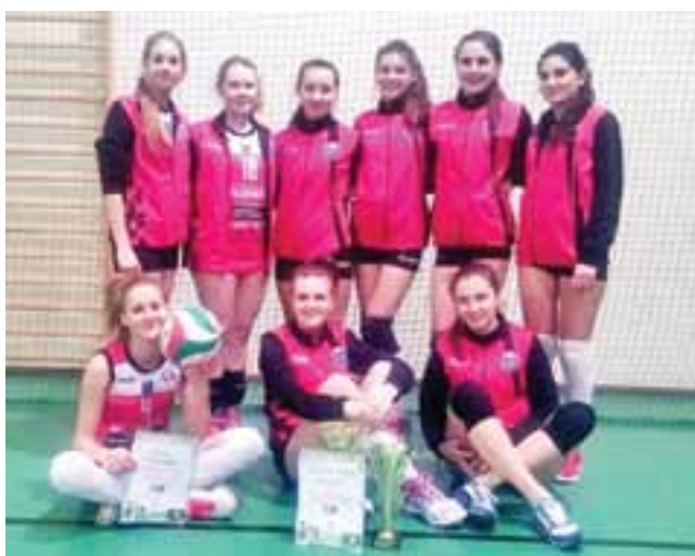
Drużyna siatkarek Volley Team Żychlin