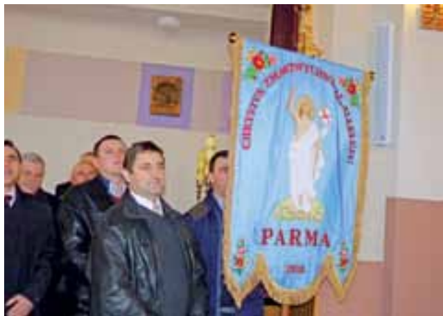
Chorągwiarze z Parmy ustawili się przed ołtarzem. Za chwilę ksiądz proboszcz poświęci nowy symbol ich wsi.