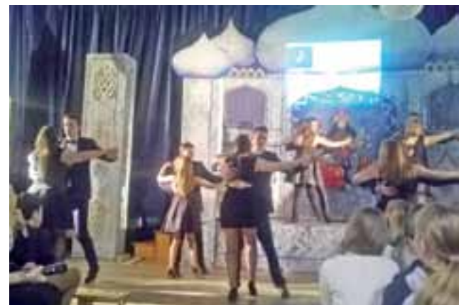
Młodzież z klasy IIIA zaprezentowała się w tańcach towarzyskich, których uczy się na zajęciach artystycznych.

Dyrektor w późniejszej rozmowie z NŁ wyjaśniła, że poza