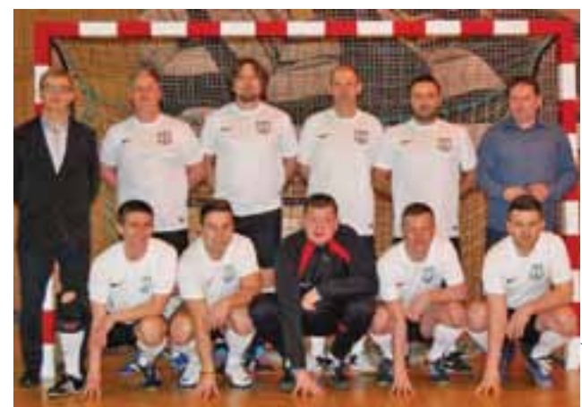
Miasto Łowicz triumfowało wygrywając z Powiatem Łowickim 3:2.