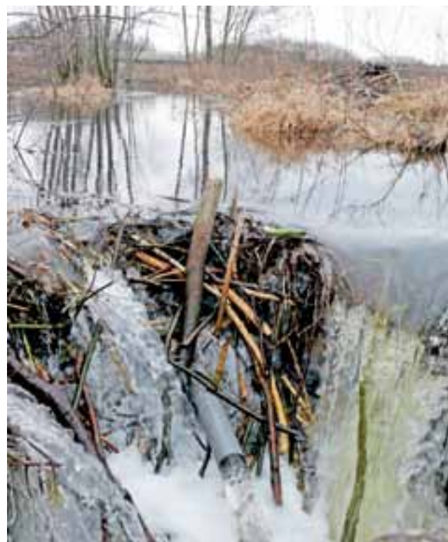
Tama w sąsiedztwie Polesia, widoczna jest plastikowa rura, którą ludzie złożyli, by zwiększyć przepływ wody.

Łyszkowice. Tu, na strudze, którą zwyczajowo mieszkańcy nazywają Ruczajem, bytuje bobrza rodzina, która za nic ma sąsiedztwo człowieka. W odległości około 300 metrów od MOP i około 200 m od autostrady (wrażenie słychać pędzące samochody) powstało na nieużytkach rozległe rozlewisko, z którego sterczą drzewa. Bobry wybudowały tamę w miejscu, gdzie struga wpada w przepust pod gruntową drogą.