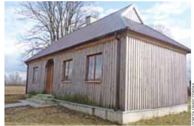
Mieszkańcy Buszkowa za pieniądze z funduszu sołectkiego

– W przyszłości drugą z sal chcemy zaadaptować na kuchnię,