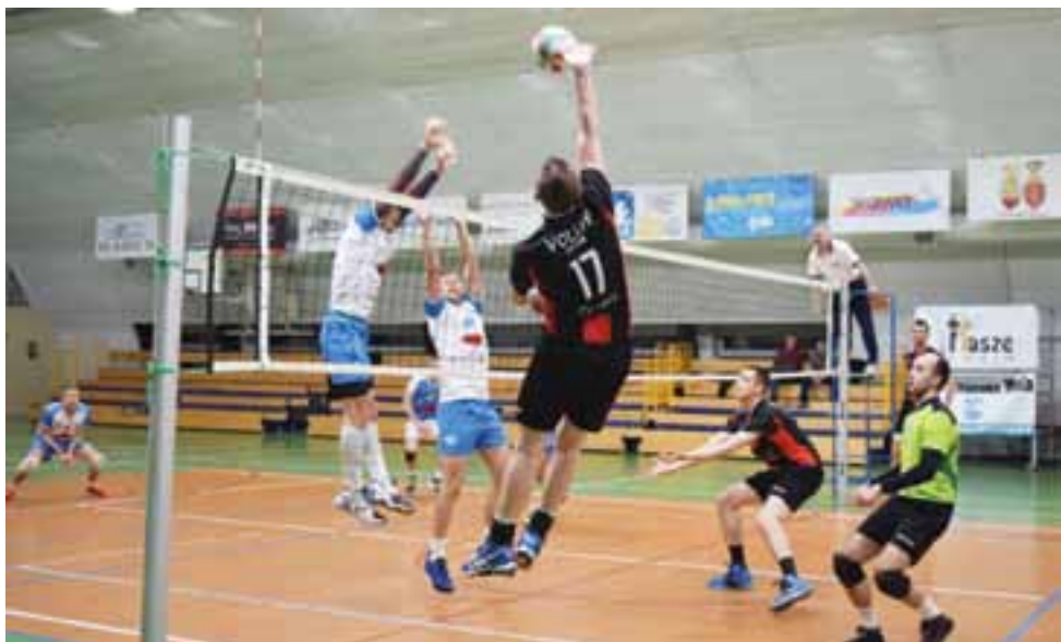
Spotkanie 15. kolejki ligi, podczas którego Volley Team Żychlin zagrał na wyjeździe z MKS Zduńska Wola.