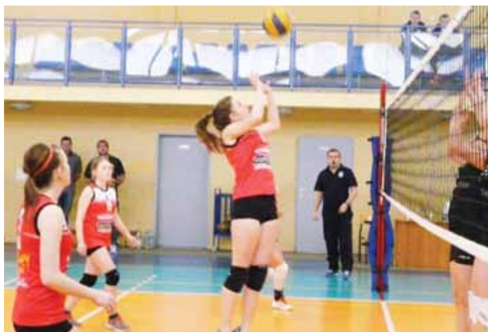
Spotkanie 16. kolejki Ekstraklasy drużyny Volley Team Żychlin przeciwko Staszic Kutno.