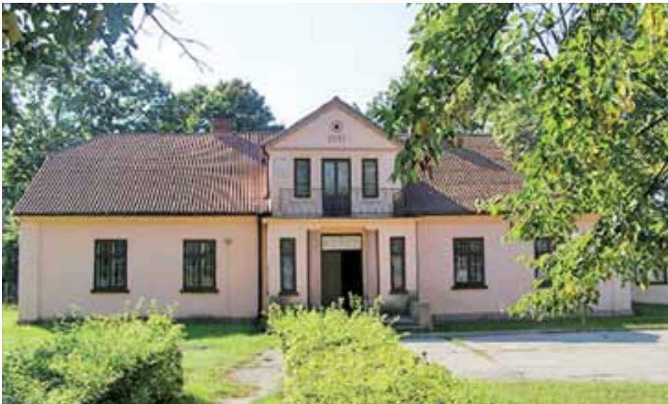
Piękny zabytkowy budynek stoi nieużywany i niszczeje. Przeniesienie do niego biblioteki to jeden z pomysłów na wykorzystanie go.

Gmina Chąsno | Przenosiny Gminnego Ośrodka Kultury