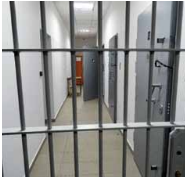
Trzech sprawców pobicia policjanta po służbie spędziło kilka dni i nocy w Policji Izbie Zatrzymań w wyremontowanej KPP Gostynin.

– Żadnego człowieka nie można bić i robić mu krzywdy. To, że ucierpiał akurat funkcjonariusz, to przypadek – podkreśla p.o. rzecznika. – Teraz sprawcami pobicia zajmie się sąd. Poblężliwości dla takiego zachowania nie ma.