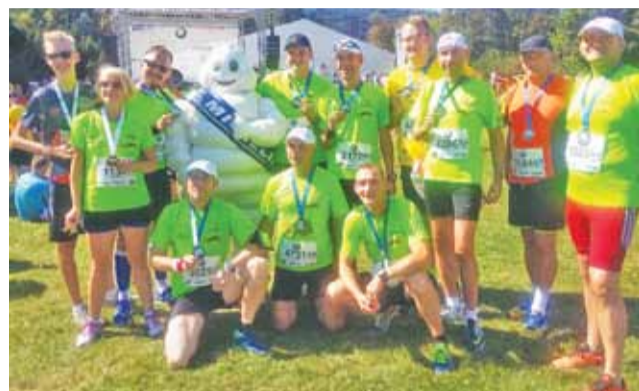
Uczestnicy trzeciej edycji BMW Półmaratonu Praskiego 2016 – grupa „Rozbiegani Żychlin”.