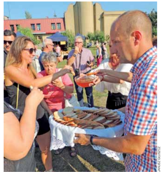
Staropolski zwyczaj dzielenia się chlebem.

Poza oglądaniem występów artystycznych zebrani mogli oglądać,