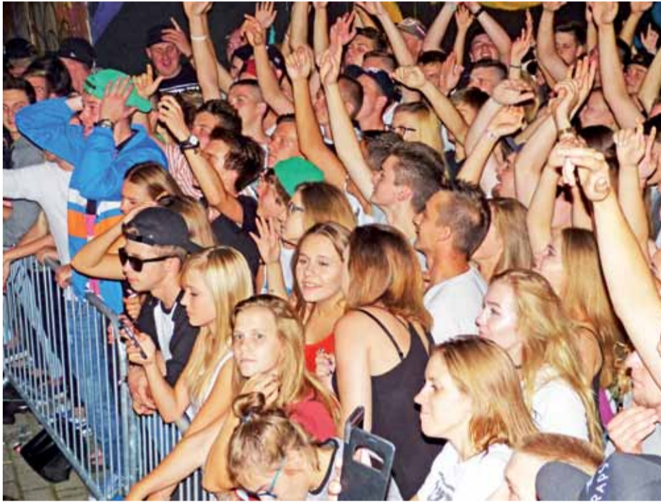
Publiczność niedzielnego koncertu stanowili głównie ludzie młodzi – jak widać zresztą na zdjęciu.

Żeby posłuchać wnuka na żywo, do Łowicza przyjechała jego 95-letnia babcia, która miesz-