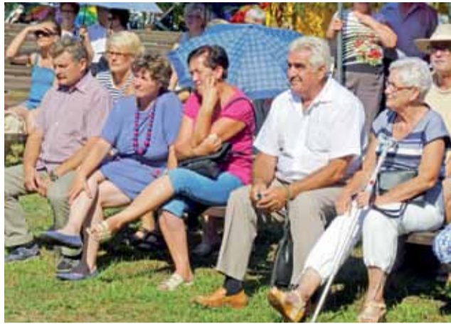
Siedząca w amfiteatrze publiczność oglądała występy w pełnym słońcu, niektórzy chronili się przed jego promieniami pod parasolkami.