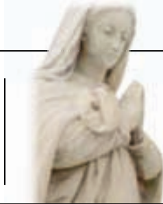
Figura Matki Boskiej z pomnika rodziny Ługowskich odzyska swój blask. str. 9

Gmina Żychlin | Spółdzielnia Mieszkaniowa Wspólny Dom