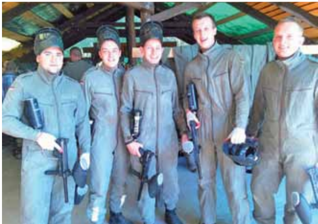
Zwycięska drużyna OSP Łowicz w strojach do paintballa.

Do Matyldowa przyjechało 18 drużyn. – Pokonywaliśmy tor przeszkód, wspinaliśmy się na ścianie do wspinaczki, pokonywaliśmy tor linowy ze zjazdami