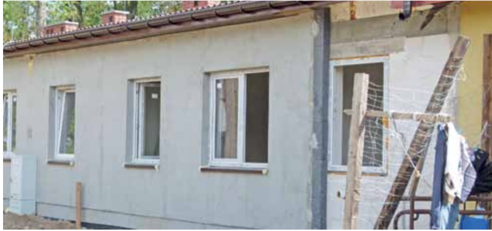
Budynek komunalny przy ul. Fabrycznej może zostać zasiedlony jeszcze w tym roku.

Do budynku mają zostać przeprowadzone w pierwszej kolej-