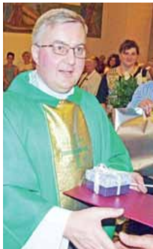
To już ostatnie uściski dłoni parafian z odchodzącym księdzem proboszczem.

„Łzy popłynęły nawet dzieciom, które specjalnie na ten dzień ubrały się w stroje łowickie i wyrecytowały z przejęciem pożegnalne wierszyki.