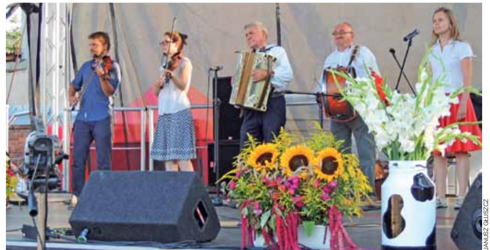
Kapela Ludowa Dobrzeliniaacy wraz z muzykami zespołu Gęsty Kożuch Kurzu podczas dożynek w Żychlinie.