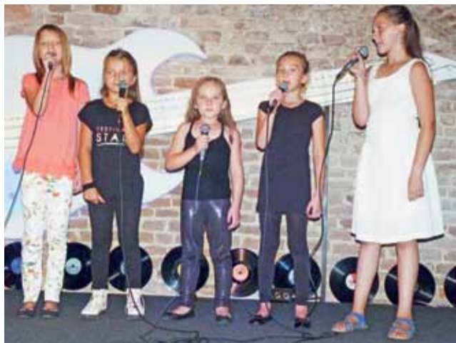
Koncert otworzyły dziewczynki z młodszej grupy wiekowej z utworem „Piosenka jest dobra na wszystko”.