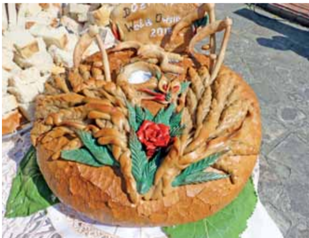
Ten piękny bochen chleba z kłosami zbóż i kłosami przynieśli mieszkańcy Woli Owsianej.

Przyniesiono dwa wieńce i trzy kosze z owocami i kwiatami. Typowy 4-ramienny wieńiec upleciony ze zbóż z Matką Boską w środku, z owocami, warzywami i kwiatami zrobił mieszkaniec trzech sołectw: Oporów, Kolonia Oporów i Dobrzewy. Oryginalny wieńiec przedstawiający studnię z wiadrem i łańcuchem zrobionym