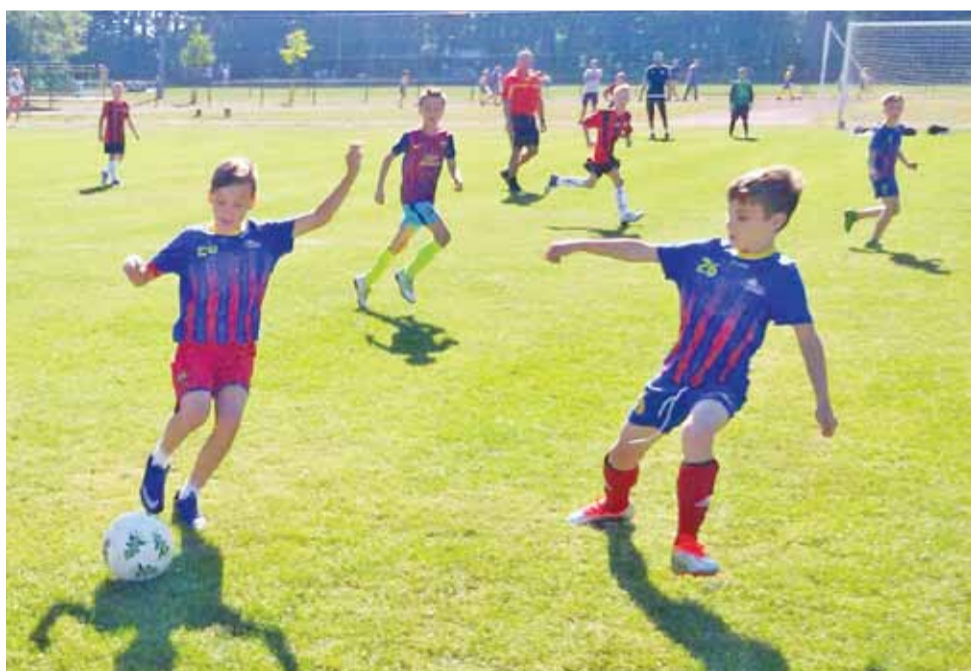
Młodzi piłkarze KS Żychlin 2006 w jednym ze spotkań podczas Ogólnopolskiego Turnieju Piłki Nożnej o Puchar Marszałka Województwa Łódzkiego dla rocznika 2006, rozegranego w Zduńskiej Woli.

Piłka nożna | Ogólnopolski Turniej Piłki Nożnej