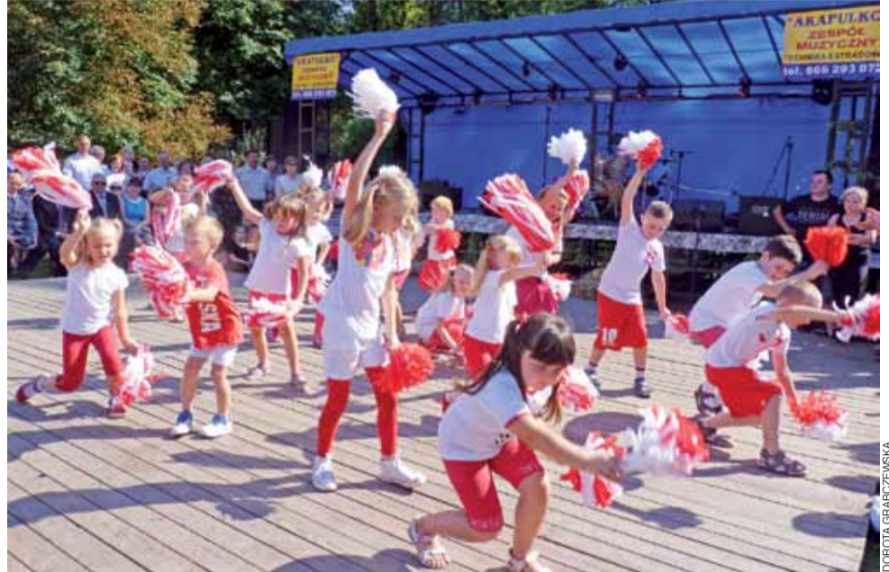
Dzieci z klas 0-III z ZS w Szczycie, zaprezentowali układ taneczny do piosenki „Kocham Cię Polsko”