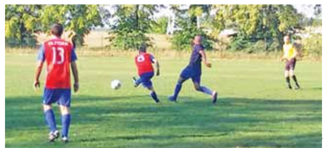
Wygrane wyjazdowe spotkanie KS Żychlin z Błękitnymi Ciosny.