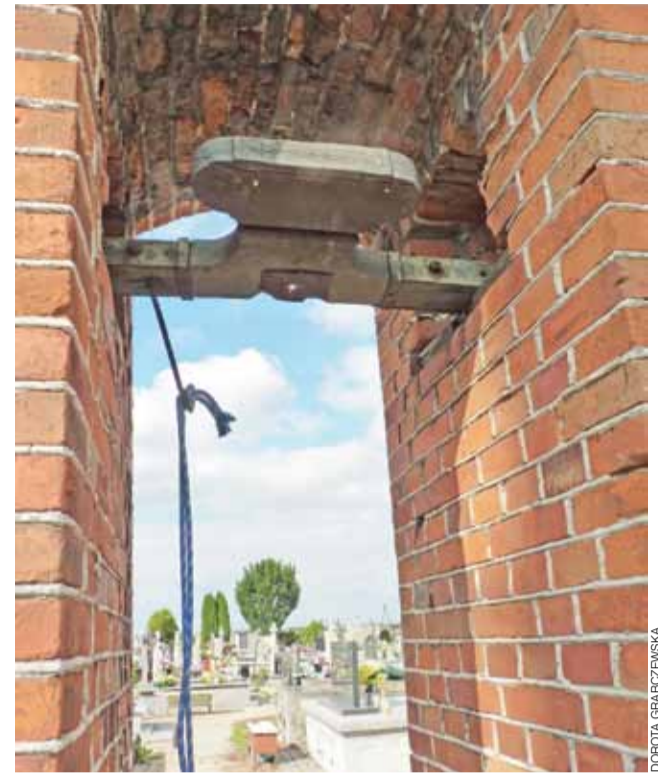
Złodzieje ukradli dzwon znajdujący się na cmentarzu parafialnym w Żychlinie. Dzwonił za każdym razem, gdy był pogrzeb.