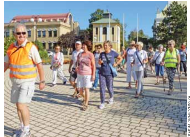
Wczoraj seniorzy z Żychlina, w ramach aktywności fizycznej, wyruszyli na pieszo i na rowerach do Oporowa, gdzie mieli grillować.

Jak mówi jubilat, przepracował 50 lat i 7 miesięcy. – Życzę wam, abyście państwo pracowali jak najlepiej dla dobra i rozwoju miasta – dodał. Podkreślał, że pomimo 2 zawałów i śmierci klinicznej, którą przeżył, wciąż żyje. Z dowcipem opowiadał o swojej wizycie w „niebie” i „piekle”. – Kazano mi wtedy wracać pomiędzy ludzi i się z nimi męczyć – mówił żartobliwie. dag