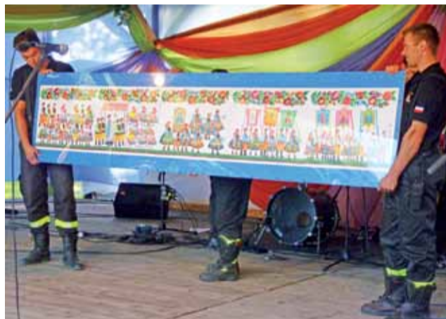
Strażacy zaprezentowali rekordową księżacką kodrę.

Wędrując między alejkami Muzeum Wsi Łowickiej można było dotrzeć do stoisk kół gospodyń