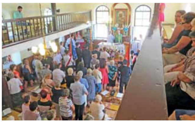
Pożegnanie księdza proboszcza odbyło się po mszy św w kaplicy w Lwówku.

Wszakże piastował on swoją funkcję od 1981 r. a więc 35 lat. – Uroczystość była niezwykle wzruszająca – nie tylko na kobiecych twarzach pojawiały się łzy – opowiada. W kościele w Osmolinie pożegnanie proboszcza przybrało nieco bardziej oficjalny charakter, a to z uwagi na