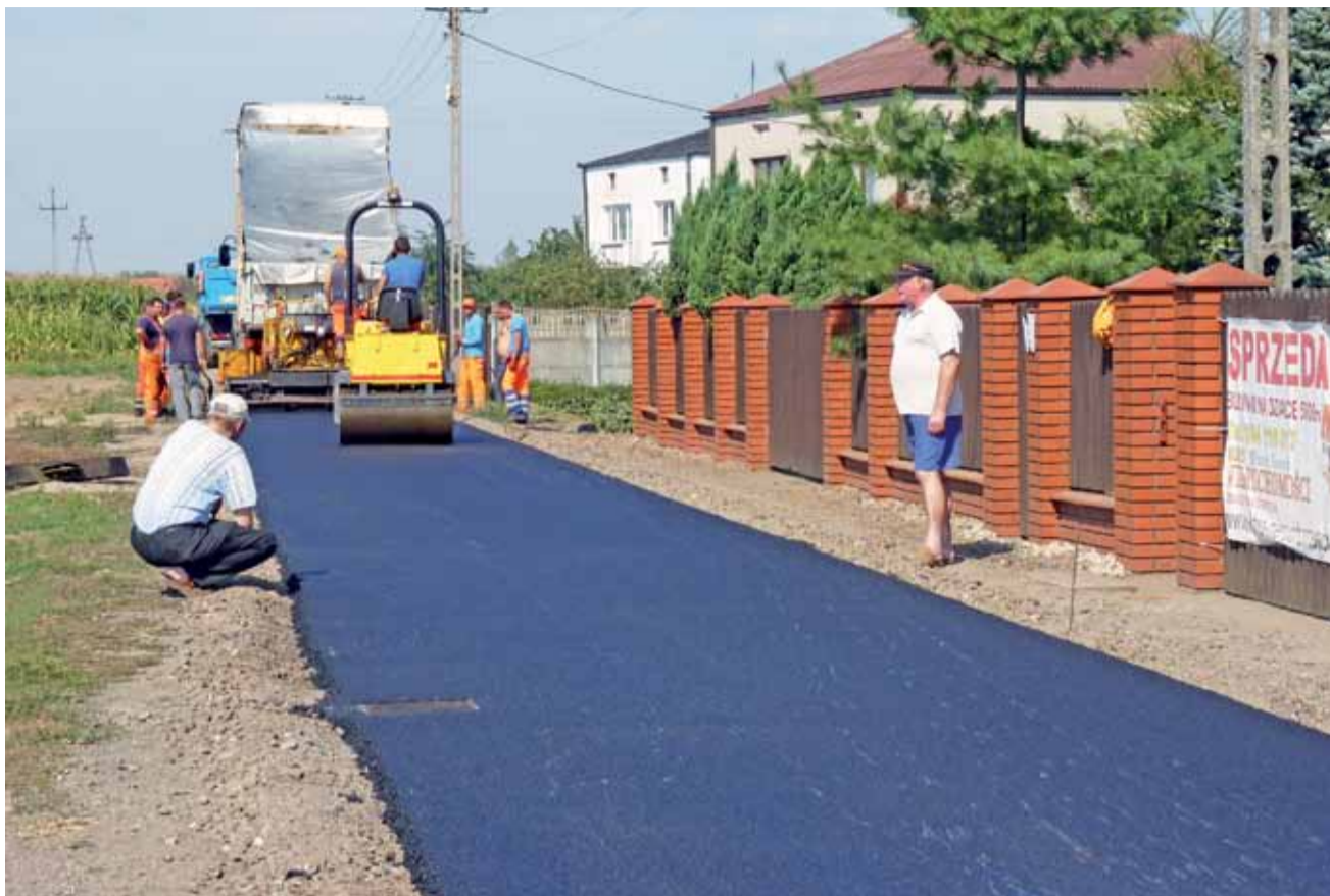
Mieszkańcy ulicy Słonecznej od poniedziałku mają asfaltową drogę zrobioną ze środków funduszu sołeckiego.

Gmina Żychlin | Zmiany na ulicy Słonecznej