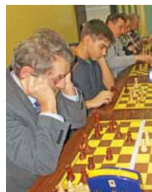
Szachiści z Łowicza rozpoczynają nowy sezon.

Rozgrywki zainaugurują szachowy sezon jesienny, który w końcówce tego roku będzie obfitował w kilka ciekawych turniejów „królewskiej gry”.