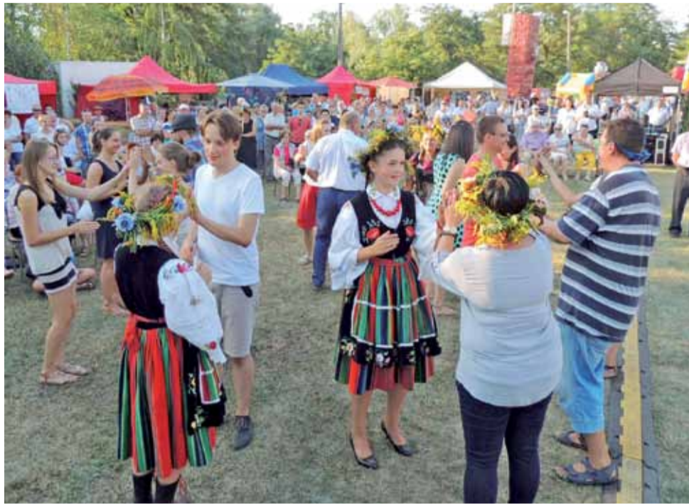
Klepok w wykonaniu mieszkańców Gminy Żychlin.

Na scenie jako pierwszy wystąpił Dziecięcy Zespół „Krzewina”, następnie na scenę wkroczył zespół Gęsty Kożuch Kurzu, któ-