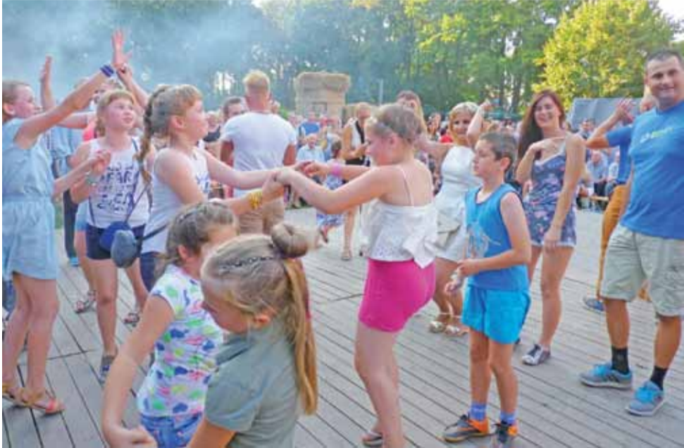
Podczas koncertu zespołu Quest uczestnicy dożynek doskonalili się bawili. Tańczono na drewnianej podłodze.