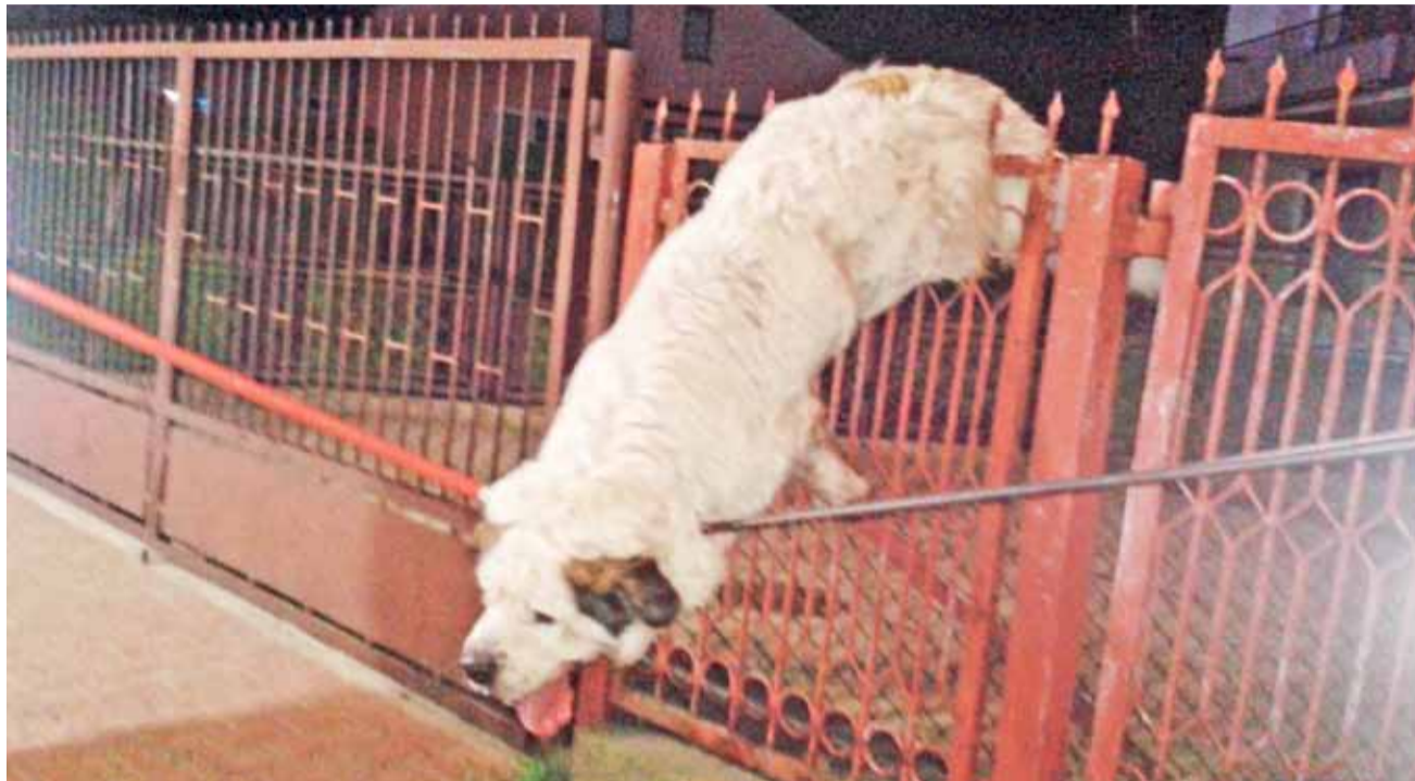
Agresywny pies zawisł na zaostzonych metalowych prętach wystających z ogrodzenia, przebiły mu one pachwinę. Aby się nie szarpał, przytrzymywano go dwoma tyczkami, na końcu których znajdowały się pętle, zacisnięte na jego szyi.

Na miejscu okazało się też, że na ulicy znajdował się mężczyzna, który miał poważną, mocno krwawiącą ranę podudzia. Został on pogryziony przez psa, gdy podjął próbę jego uwolnienia. Strażacy w pierwszej kolejności udzieli-