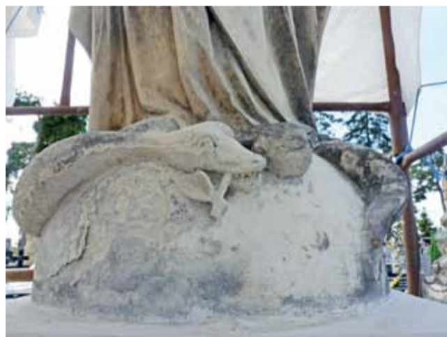
U stóp figury Matki Boskiej, która poddawana jest renowacji, leży wąż z jabłkiem, który też odzyska dawną świetność.

Dzwon raczej nie miał wartości historycznej. Można tylko przypuszczać, że albo został skradziony na złom, albo na zamówienie dla kogoś „konesera”. dag