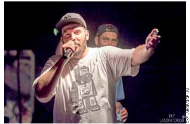
O.S.T.R. na scenie. Muzyk przyciągnął na dziedzińiec ŁOK ponad 600 słuchaczy, bijąc swoim koncertem rekord frekwencyjny tego miejsca.

Kilka dni po koncercie Facebook zasypały zdjęcia fanów z rapera.