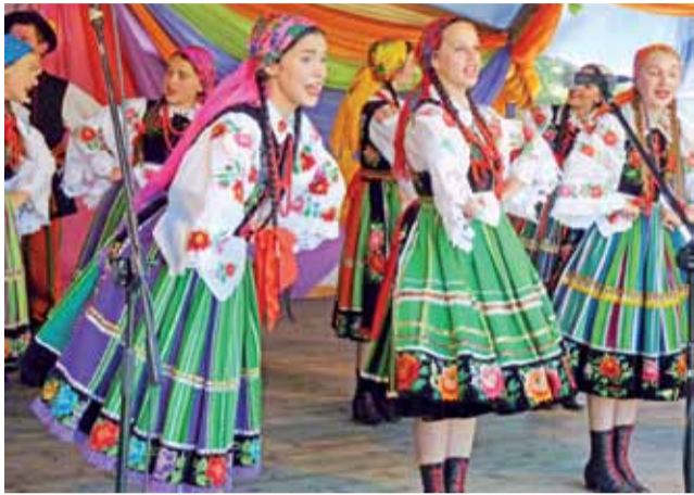
Na scenie zaprezentował się z energicznym programem Zespół Pieśni i Tańca „Blichowiacy”.

700 osób na jubileuszowym koncercie chopinowskim w Sannikach str. 23