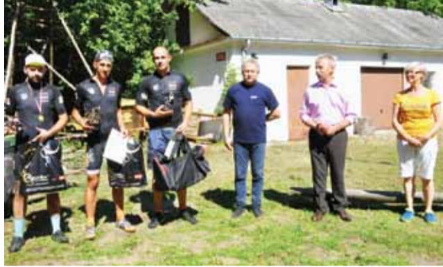
Najlepsi zawodnicy Crossu w Lasku Miejskim wraz z organizatorami.