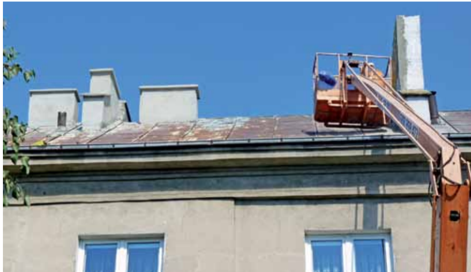
Na bloku Waryńskiego 2 trwa naprawa kominów, wkrótce rozpocznie się remont dachu. W tym roku budynek zostanie podłączony do centralnego ogrzewania.

Remont tego dachu miał być przeprowadzony rok temu. Spółdzielnia kupiła nawet papę termozgrzewalną, ale aura uniemożliwiła wykonanie prac. Teraz trwają roboty przy naprawie 7 kominów znajdujących się na dachu. Niektóre z nich trzeba było częściowo rozebrać, gdyż cegły ledwie się trzymały. Na wszystkich kominach robione są tzw. obramki z wypustami, które sprawią, że woda deszczowa nie będzie lać się po ścianach kominów,