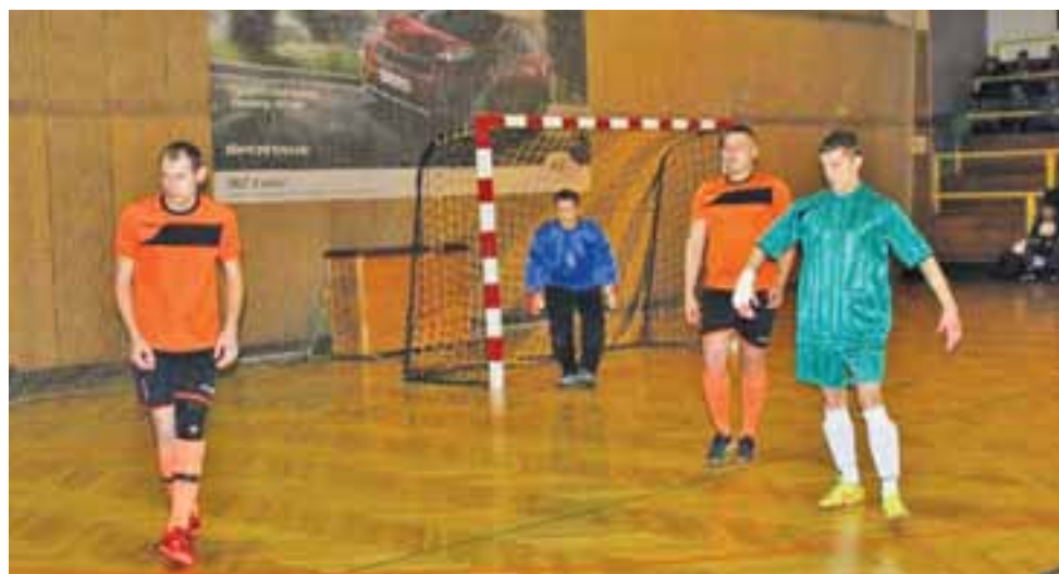
KS Stefan podzielił się punktami z Zabostowem

Dużo działo się także w meczu KS Stefan z Victorią Zabostów. W meczu drużyn z dolnych rejonów tabeli już do