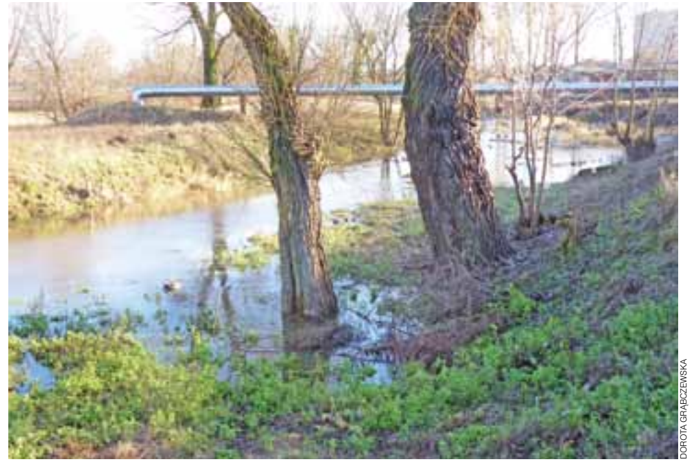
Słudwia, przepływająca przez Żychlin, wystąpiła z koryta. Zwykle to bywa na wiosnę – teraz zdarzyło się w grudniu.