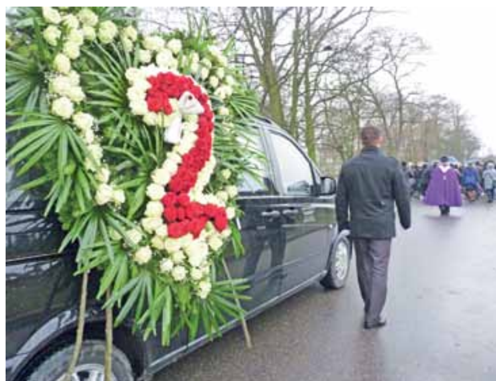
Wieniec w formie serca z białych róż z czerwoną dwójką w środku – pożegnanie ze strony szkoły.

Do czasu ogłoszenia decyzji sądu, ani prokuratura, ani CBŚP nie udzielały szczegółowych informacji na temat akcji przeprowadzonej przez 200 funkcjonariuszy w kutnowskiej ubojni. str. 2