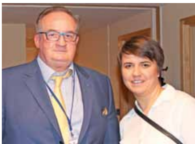
Eurodeputowany Jacek Saryusz-Wolski i Katarzyna Skierska-Pięta.

Głównym celem wyjazdu był udział w panelu dyskusyjnym dotyczącym obszaru szeroko rozumianej polityki senioralnej, w tym aktywizacja osób w wieku poprodukcyjnym. Jak podkreśla Paweł Pięta, realizacja działań na rzecz seniorów jest przede wszystkim ważna w Łowiczu, ponieważ z roku na rok zmniejsza się liczba ludności (6% na przestrzeni 10 lat), w tym osób w wieku przedprodukcyjnym