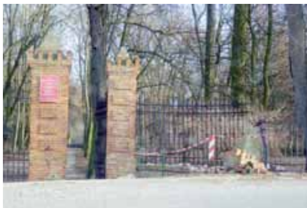
Ogrodzenie wokół zamku w Oporowie znów uszkodzone. Po raz kolejny w ogrodzenie wjechał nieostrożny kierowca.

Póki co, uszkodzenie zostało tymczasowo zabezpieczone taśmami i siatką od strony parku. – Robimy też precyzyjny kosztorys – mówi dyrektor. – Ponieważ zniszczony słup ogrodzeniowy