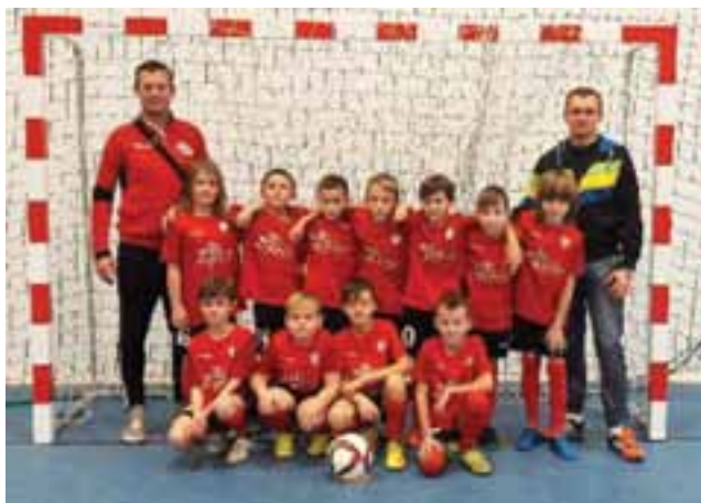
Zwycięzcy Turnieju Piłki Nożnej o Puchar Wójta Gminy Zduny – zespół KS Żychlin rocznik 2007 i młodsi.