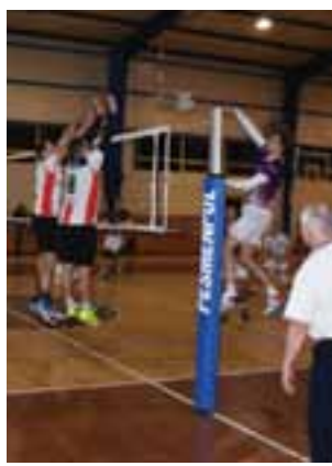
8. kolejka przyniosła Volley Team Żychlin przegraną 1:3 z obecnym liderem Kasztelan Rozprza.