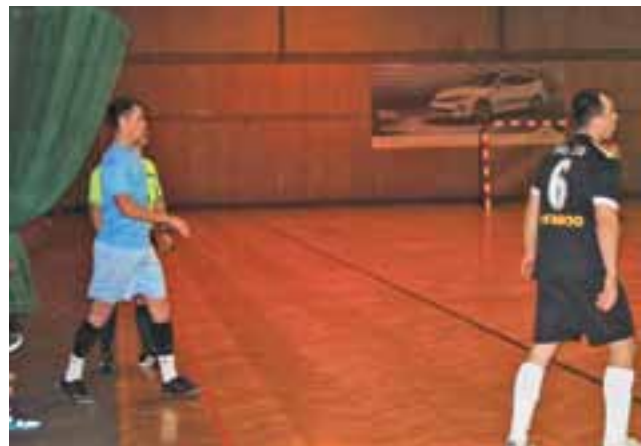
Dark-Chińska II wygrała z No.16 3:0

Siedem goli i komplet punktów to wynik Karczmy Bednar-