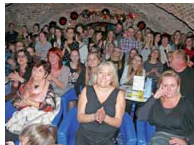
Pomieszczenie, w którym odbywały się koncerty, wypełniło się publicznością po brzegi. Na pierwszym planie nauczyciele z Gimnazjum w Popowie.