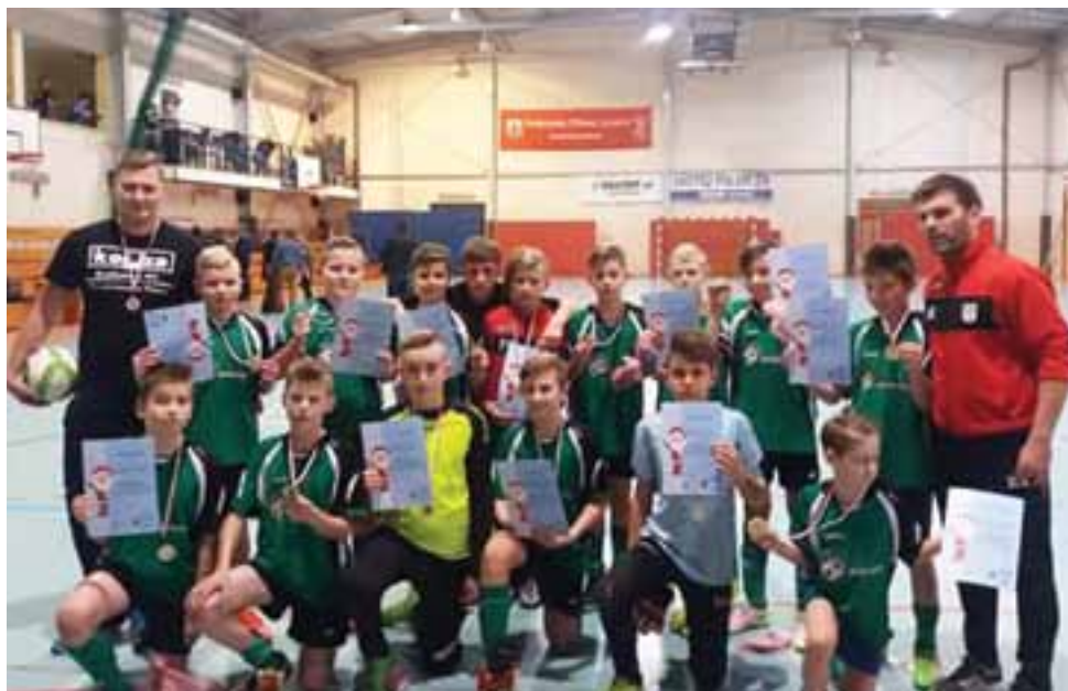
Młodzi piłkarze GKS Bedno rocznik 2005/2006 – zwycięzcami Turnieju Mikołajkowego w Halową Piłkę Nożną o Puchar Burmistrza Miasta Łęczycy.