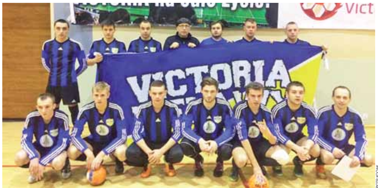
Victoria Bielawy zajęła trzecie miejsce w Mistrzostwach Polski