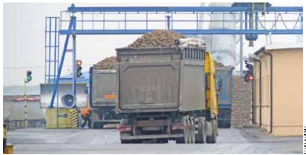
Kampania cukrownicza ma się zakończyć przed Wigilią. Dziennie przerabianych jest 4700 ton buraka.

Dyrektor ocenia, że kampania 2016 roku jest średnią. Nie ma ani euforii, ale też nie jest źle. Rolni-