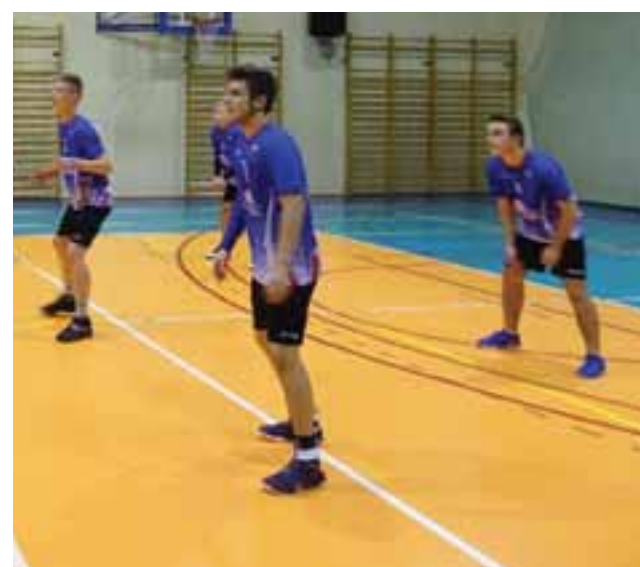
Akademia Siatkówki Żychlin w wygranej spotkaniu z zespołem Nowożytni Kutno.