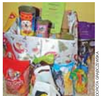
Karma dla psów i kotów

Wreszcie się udało i czworonożniem zajął się jeden z okolicznych