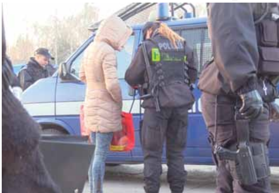
Podczas akcji 5 grudnia funkcjonariusze przeszukiwali kilkuset pracowników ubojni Pini Polonia.

Decyzją łódzkiego sądu są zbulwersowani również zwykli pracownicy i mieszkańcy. – Po pierwsze 10 mln zł to bardzo mała kwota jak na takiego przedsiębiorcę, który w Kutnie ma trzy