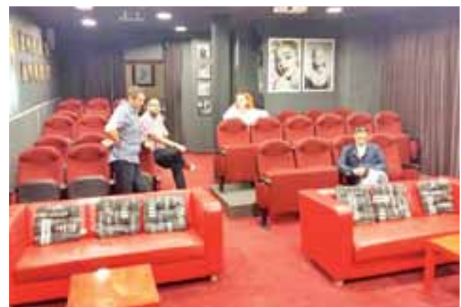
Art House Awangarda w Olsztynie, czyli jeden z wielu przykładów aranżacji kameralnej sali kinowej.

Do PISF trafił już wniosek o pozyskanie środków na zamontowanie klimatyzacji w sali kina Fenix. Ośrodek spodziewa się otrzymać decyzję o przy-