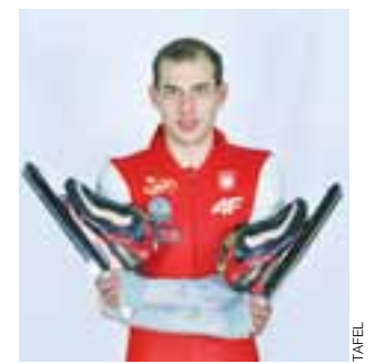
Sesja studyjna ze Zbyszkim Bródką. Puchar Świata w Inzell, 2015 r.

Ostatniego dnia zawodów Zbigniew Bródka pojawił się po raz trzeci na torze Thialf. Wystąpił w grupie B w biegu na 1000 metrów. Domaniewicz z czasem 1:10.65 zajął 12 miejsce wśród 34 startujących zawodników. Start ten miał być niejako przetarciem, sprawdzieniem dyspozycji przed rozgrywanymi w najbliższy weekend w Warszawie Mistrzostwami Polski. W zawodach tych przyjdzie mu się ścigać na wszystkich dystansach od 500 metrów do 5000 metrów. W ubiegłym roku dla Zbigniewa Bródki impreza ta pomimo słabego całego sezonu była niezwykle udana: zwycięstwa na 1000 m, 1500 m i 3000 metrów oraz drugie miejsce na 5000 metrów i w wieloboju. Mamy nadzieję, że i tym roku będzie podobnie.