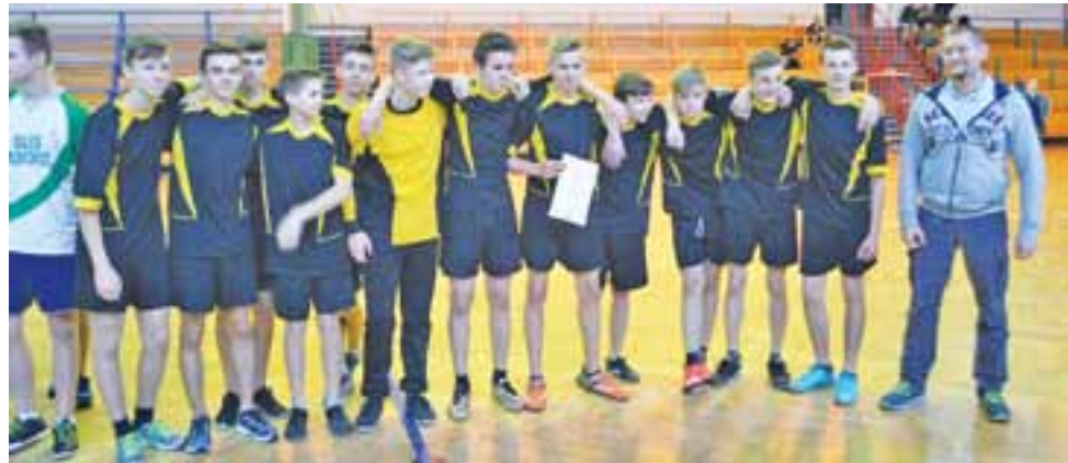
Gimnazjaliści z Kompiny odnieśli duży sukces, wygrywając mistrzostwa rejonu

Wyniki Rejonowej Gimnazjadzie Szkolnej w piłce ręcznej chłopców: