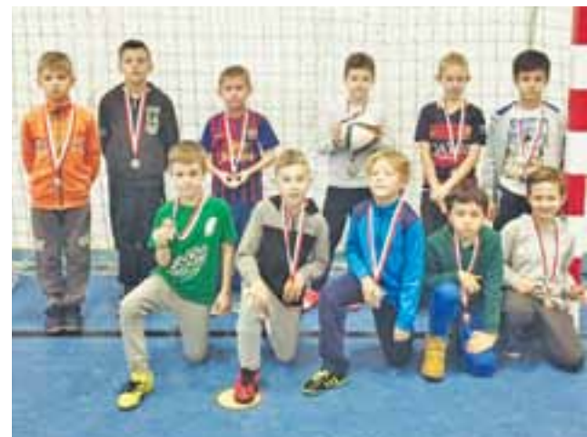
Gracze Pelikana 2008 zagraли z starszymi w Zdunach