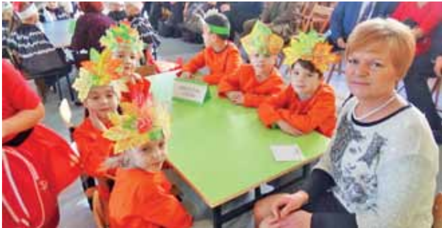
Drużyna Listków z przedszkola w Skrzyszewach.