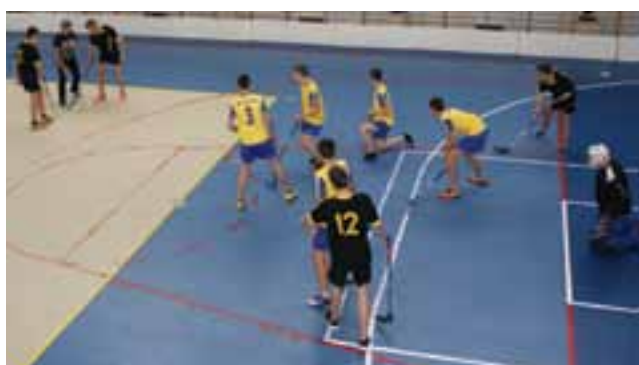
Rozgrywki pomiędzy zespołem chłopców Gimnazjum Bedno a Gimnazjum Nr 1 Kompina.

9 grudnia w sali sportowej Gimnazjum w Bednie odbył się półfinał województwa w unihokeju dziewcząt i chłopców w ramach Gimnazjady. Organizatorem zawodów był MOSiR Kutno. Wzięły w nich udział reprezentacje drużyn dziewcząt i chłopców z powiatów: kutnowskiego, łowickiego, rawskiego, skierniewickiego, miasto Skierniewice. Awans do finału województwa dziewcząt wywalczyło Gimnazjum Bielawy (powiat łowicki). Natomiast awans do finału województwa chłopców wywalczyło Gimnazjum Bedno (powiat kutnowski). Finał wojewódzki rozegrany zostanie w Uniejowie 15-16 grudnia 2016r. mr