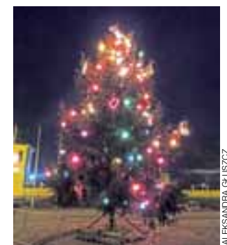
Choinka została zapalona w obecności niewielu świadków.

Ostatecznie choinka rozbłysła o 17 w obecności niespełna 20 osób.