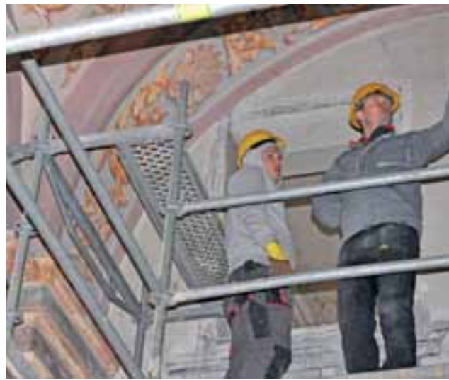
Pracownicy krakowskiej firmy AC Konserwacja zakończyli roboty konserwacyjne polichromii w nawie wschodniej kościoła pijarskiego.

wienie w ciągu jednego roku także polichromii w nawie zachodniej. Niestety nie udało się, ale pijarzy już złożyli kolejny wniosek o dofinansowanie konserwacji w drugiej nawie. – Wniosek złożyliśmy w terminie do końca października, decyzji spodziewamy się w lutym przyszłego roku. Zakres robót będzie podobny. Tym razem chodzi o cztery przęsła w zachodniej nawie – powiedział nam o. Galas. Rusztowania zostaną ponownie ustawione w kościele pijarskim (tym razem po prawej stronie patrząc w stronę ołtarza) – o ile zostaną przyznane pieniądze na konserwację – wiosną przyszłego roku. mak