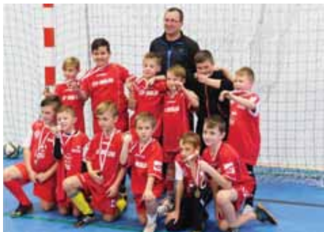
Drużyna GKS Bedno zajęła trzecie miejsce w turnieju piłki nożnej w Zdunach.

Piłka nożna | Turniej o Puchar Wójta Gminy Zduny