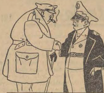
TITO: Mamy teraz z panem, mister Churchill wspólne interesy... amerykańskie!